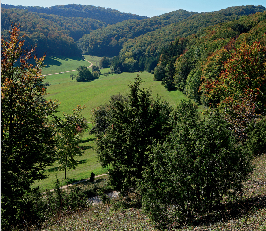
Tal unterhalb des Boßler bei Bad Boll.

Wir gehen vom Wanderparkplatz in Eckwälden (1) bei Bad Boll entlang der Dorfstraße durch Eckwälden und orientieren uns dabei am roten Strich des Schwäbische-Alb-Oberschwaben-Wegs HW 7 . Am Ende des Firmengeländes der Wala-Heilmittel-GmbH (Führung durch den Heilkräutergarten) geht es links auf dem Eckwälder Weg und rotem Strich in Richtung Boßler. Wir wandern oberhalb des Teufelslochs entlang. Der Teufelsklingenbach hat hier eine tief eingefurchte Schlucht geschaffen; in ihrem hinteren Teil fällt er beim »breiten Stein« in Kaskaden 50 m tief über eine Sandmergelbank. Der Wanderweg zweigt rechts von der Schotterstraße ab und führt als schmaler Pfad den Waldhang hinauf. Nach 100 m quert er einen Schotterweg und führt geradeaus weiter (Schild Naturfreundehaus Boßler). Wir folgen 200 m der Forststraße, dem Boller Hangweg , und unterqueren links die Autobahn. Danach gehen wir ein kurzes Stück an der Autobahn entlang bis zur